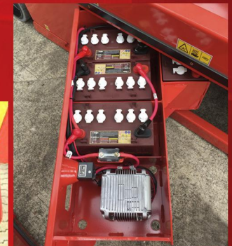
Gabinete de baterías